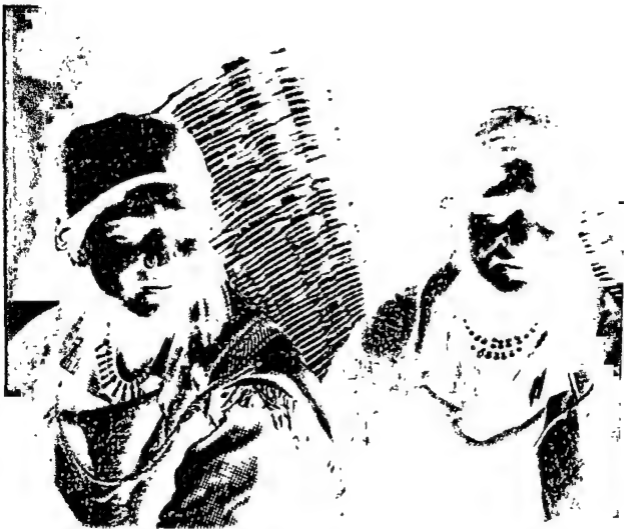
मनाली की घुबतियां